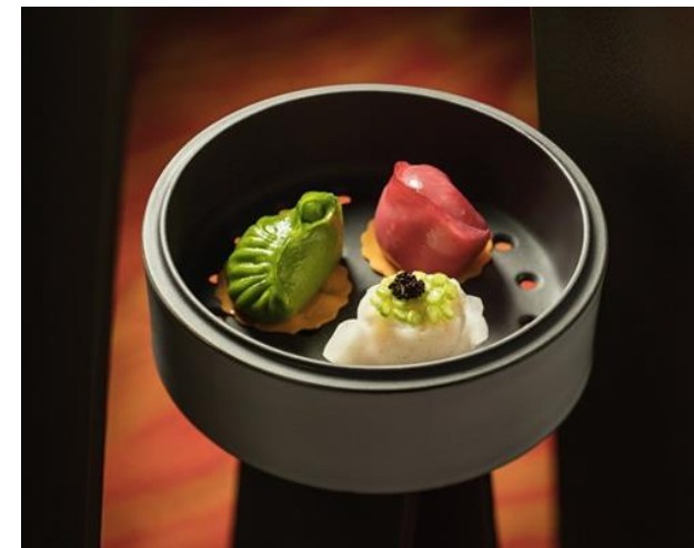
Calvin SOH City of Dreams Macao

« Je tiens à toujours agrémenter mes créations d'une note d'audace. Le travail des formes, textures et couleurs de la collection Equinoxe invite à jouer avec les contrastes. »