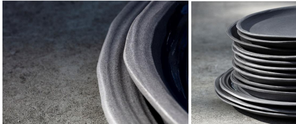
Le design accompagne les déformations naturelles de la pâte pour assurer un maximum de 1 er choix à la sortie du four et une parfaite empilabilité