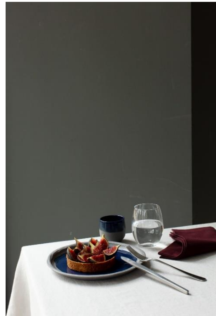
Tarte aux figes