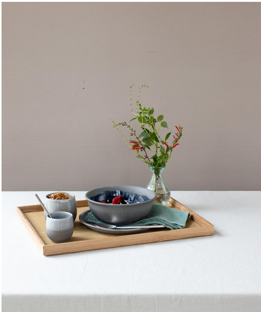
Room service : Granola, fruits frais et fromage blanc

TENDANCES CULINAIRES : petit-déjeuner sain et équilibré, dressage pictural d'une cuisine revisitée, accords subtiles des couleurs