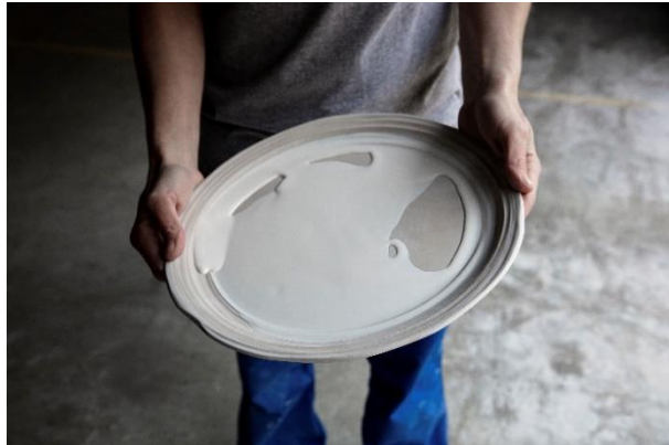
La juste quantité d'émail recyclé est répartie dans l'assiette pour un rendu aléatoire