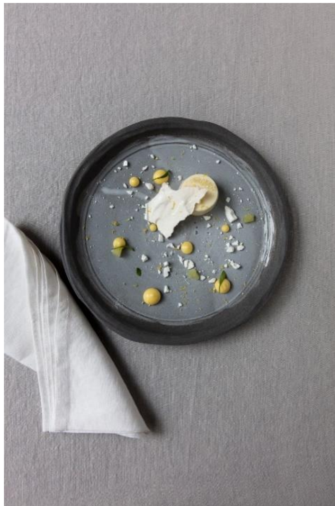
Douceur citronnée à la meringue