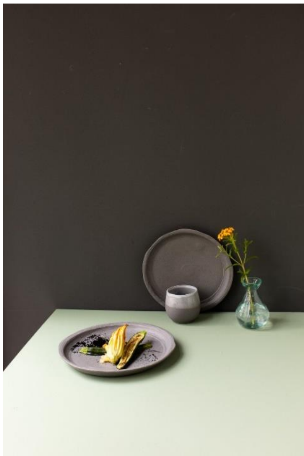
Déclinaison de courgettes