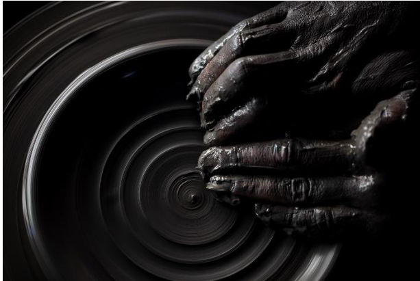
A la conception, le modeler marque de son empreinte le design de l'assiette.