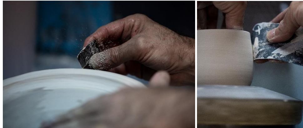
La finition manuelle donne à l'objet son supplément d'âme et son caractère unique.