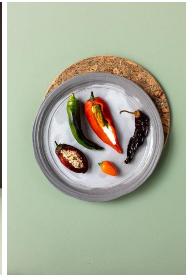
Poivrons farcis & piments