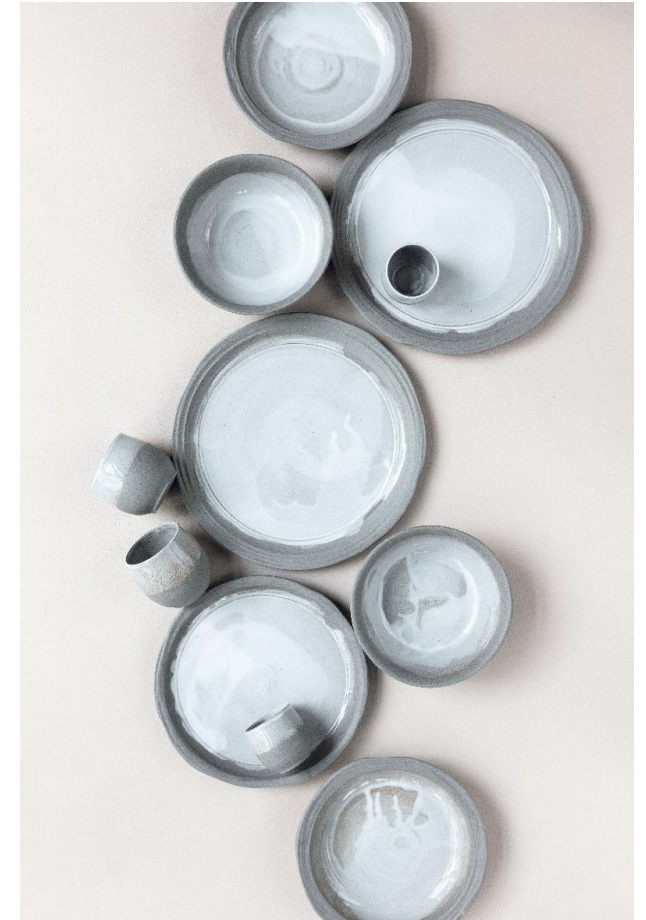
3 coloris, tous recyclés